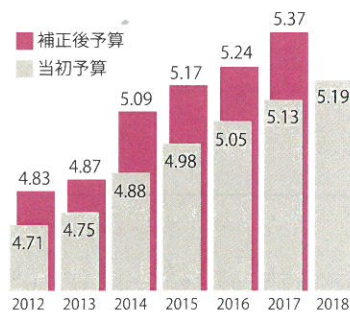
増え続ける軍事費 (兆円)

9条に「自衛隊」を明記すれば、9条が死文化されます。「自衛隊員を戦場に送り、海外で武力行使する国」になってよいのでしょうか。