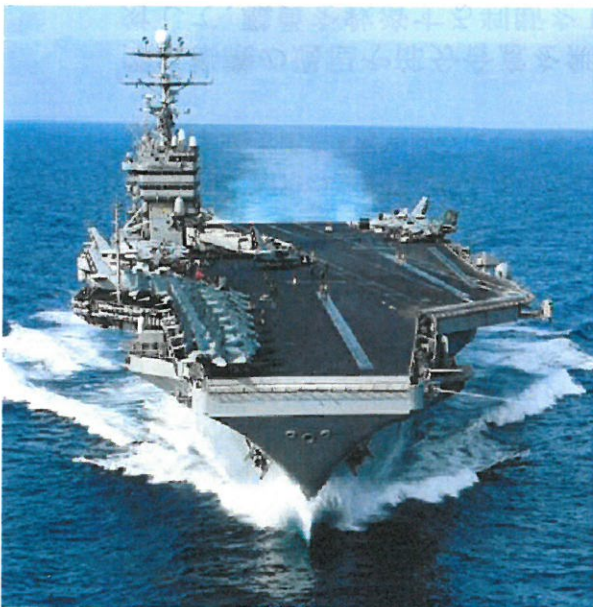
【原子炉2基を積む米原子力空母=東京湾に浮かぶ原発】

2008年9月、米原子力空母ジョージ・ワシントンが事実上の「母港」として横須賀に配備されました。2015年10月、米原子力空母ロナルド・レーガンが交代配備されました。日米両政府は、横須賀を米空母の出撃基地として恒久的に使おうとしています。安倍内閣は「戦争する国」にするため戦争法を強行し、憲法の明文改憲をも狙っています。「戦争する国」の法的枠組みが戦争法（憲法改悪）であり、横須賀への米原子力空母配備や辺野古の新基地建設などは、その軍事的基盤です。両者は一体のものです。