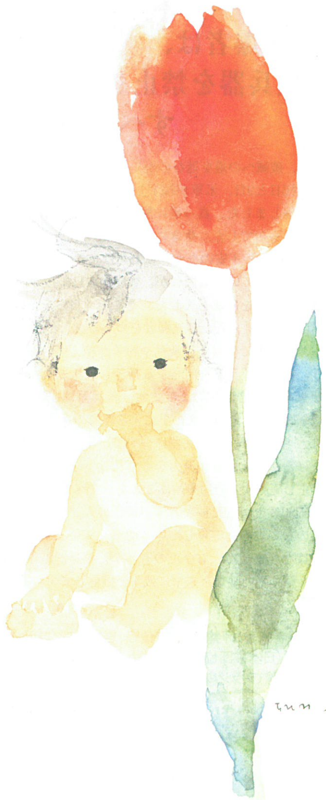
いわさきちひろ チューリップとあかちゃん (1971年)